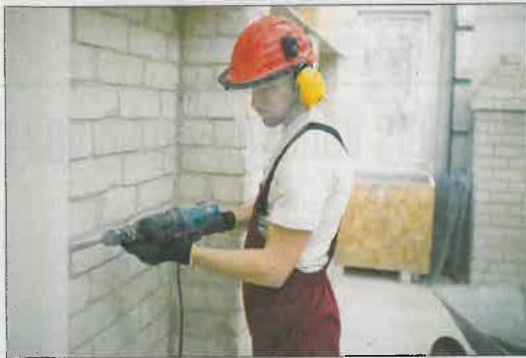
Pameistrystė – greičiausias būdas užsitikrinti darbo vietą: įgyti kvalifikaciją ar persikvalifikuoti ir pradėti dirbti pagal norimą specialybę.

ir darbo sutartis, be to, yra galimybė likti dirbti pagal įgytą profesiją. Žmogus ir mokosi, ir kartu gauna atlyginimą iš darbdavio“, – sako jis ir prisimena, kaip negalėdamas mokytis su kitais mokykloje asmuo pasirinko pameistrystės formą ir tapęs motyvuotu darbuotoju liko sėkmingai dirbti vienoje statybų bendrovėje.