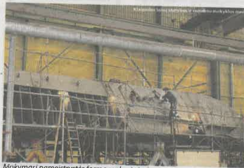
Mokymąsi pameistrystės forma renkasi vis daugiau žmonių.

„Lietuvoje yra nemažai suaugusiųjų, kurie gyvena tarsi užburta me rate – jie nėra įgiję vidurinio išsilavinimo ir dirba nekvalifikuotus darbus. Dirbdami visą dieną tokie žmonės neturi kaip mokytis. Pameistrystė jiems gali tapti išėjimu, nes sudaroma mokymosi ir darbo sutartis, be to, yra galimybė likti dirbti pagal įgytą profesiją. Žmogus ir moko-