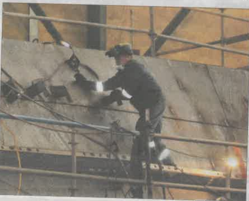
Klaipėdos laivų statybos ir remonto mokėslų mokykla