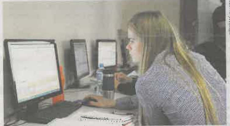
Individualizuotas mokymas leidžia geriau ir greičiau perprasti konkrečią sritį.

Vilniaus technologijų ir verslo profesinio mokymo centre pa-