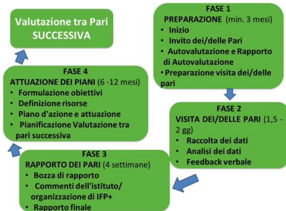
Figura 4: Quattro fasi della Valutazione tra Pari europea