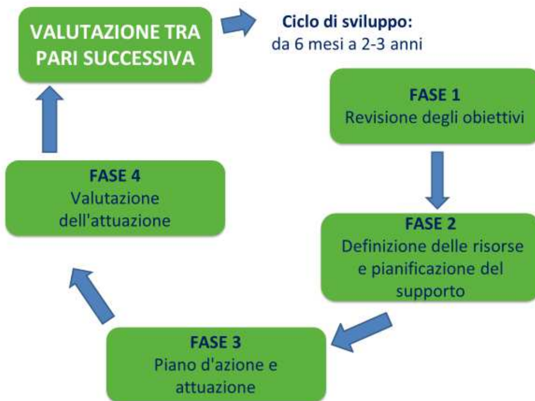
Figura 7: Dalla conoscenza all'azione