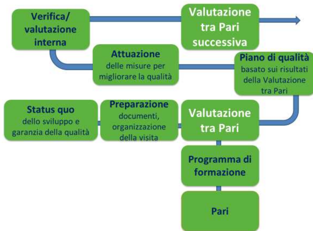
Figura 1: Miglioramento continuo della qualità con la Valutazione tra Pari