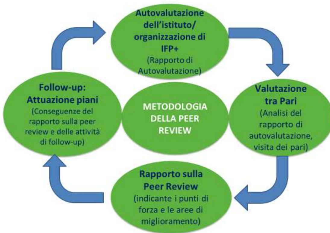
Figura 2: Modello di Garanzia della Qualità EQAVET e Valutazione tra Pari

In questo quadro, la Valutazione tra Pari europea e l'insieme di Aree Qualità definite possono essere utilizzati come strumento per garantire e migliorare la qualità in tutti i sotto-settori dell'istruzione e della formazione, per qualsiasi tipo di apprendimento ed a prescindere dall'ambiente didattico. La metodologia può essere utilizzata per un'ampia valutazione interna (autovalutazione), oppure per una valutazione esterna della qualità dell'istruzione e formazione erogate. La metodologia, intesa come procedura sistematica, può essere descritta come segue: