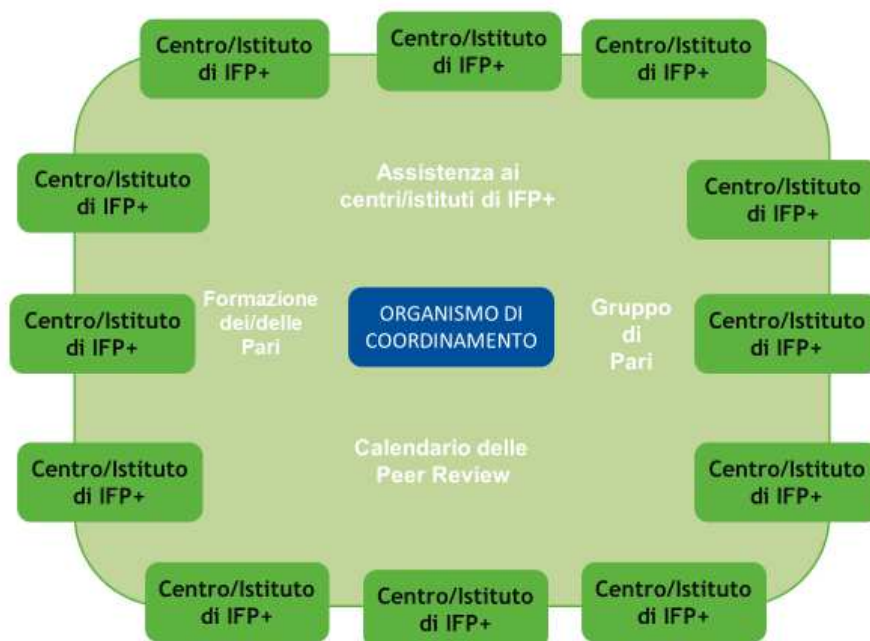
Figura 3: Valutazione tra Pari in Rete

La ricerca condotta per adattare il Manuale ha sottolineato come sia importante che le Valutazione tra Pari vengano eseguite in modo coordinato.